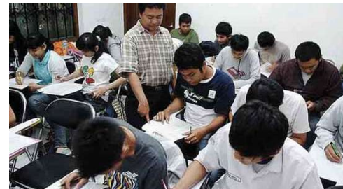
pengetahuan tambahan pelajaran hanya bisa pada les