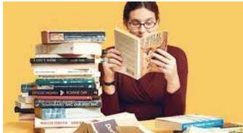
referensi belajar hanya dari buku